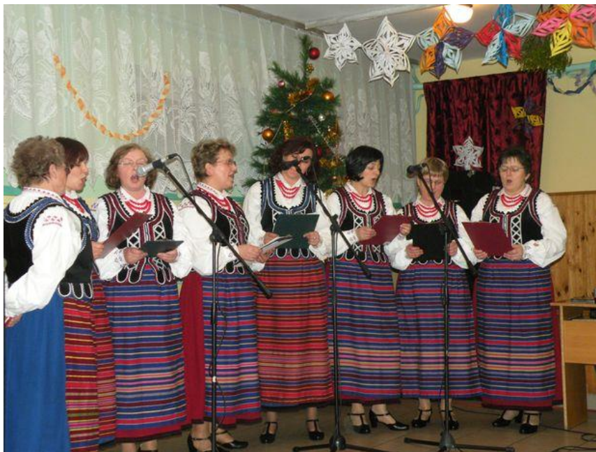
Rysunek nr 3. Przegląd kolęd i pastorałek z 2008 r.