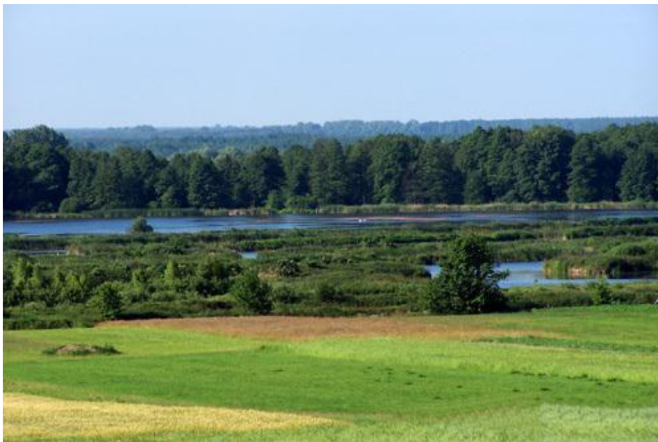
Rysunek nr 1. Rozlewiska rzeki Wieprz