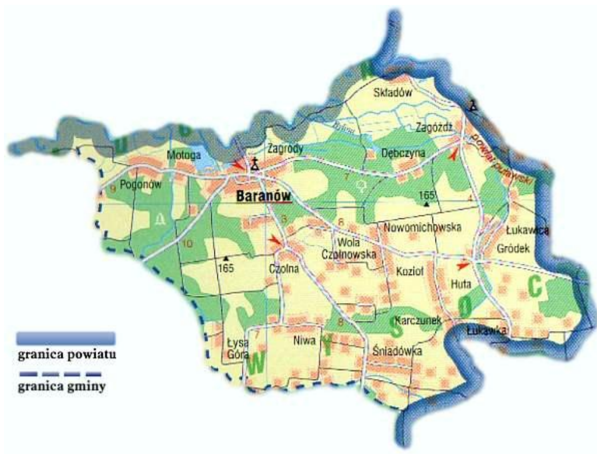
Mapa 1. Układ przestrzenny gminy

Powierzchnia Baranowa wynosi 28 km 2 , co stanowi 32 % całkowitej powierzchni gminy. Miejscowość zamieszkuje 1690 osób, co stanowi 39 % ludności gminy. W Baranowie mieści się siedziba władz gminy. Miejscowość jest położona w odległości 20 km od Puław (siedziba władz powiatu) i 65 km od Lublina (siedziba władz województwa).