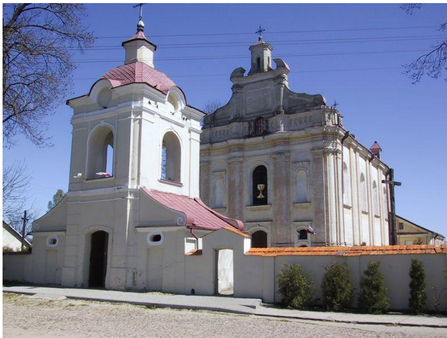
Rysunek nr 2. Kościół parafialny pod wezwaniem Świętego Jana Chrzciciela

Ponadto na obszarze miejscowości znajdują się obiekty figurujące w ewidencji dóbr kultury gminy Baranów: pozostałości zespołu dworskiego, obejmujące lamus, mur. XVIII w. i pozostałości parku, XVIII w., budynek „Nowej Apteki” przy ul. Błotnej, mur. 1928 r., dom przy ul. Puławskiej, I poł. XX w., cmentarz parafialny, 1829 r., cmentarz żydowski, I poł. XVII w.