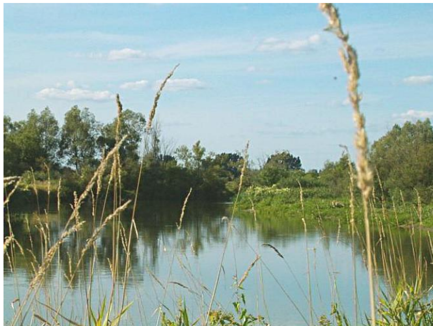
Rysunek nr 1. Rzeka Wieprz