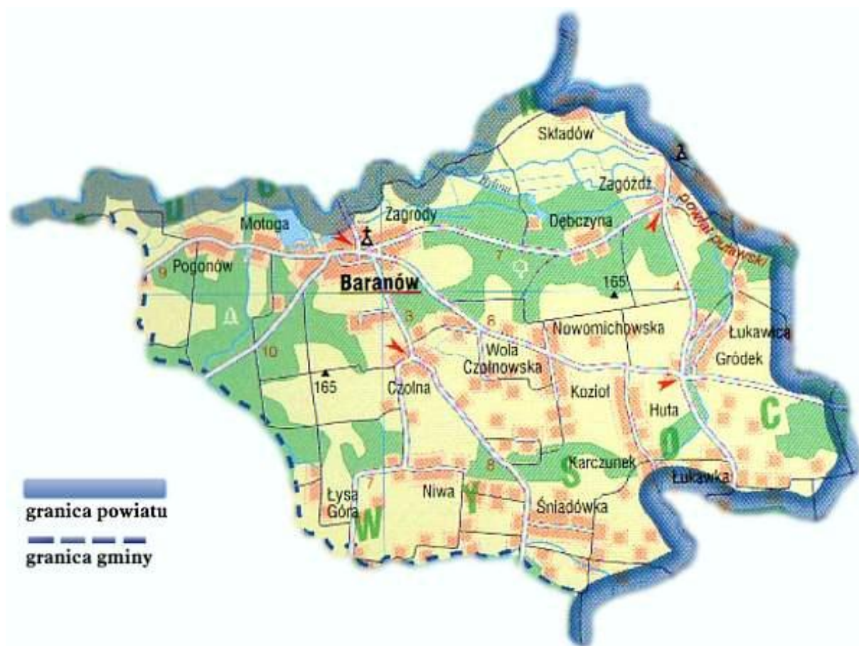
Mapa 1. Układ przestrzenny gminy Baranów i położenie miejscowości Koziół

Miejscowość zamieszkuje 219 osób, co stanowi ok. 5 % ludności gminy Baranów. Koziół jest położony w odległości 4 km od Baranowa (siedziba władz gminy), 23 km od Puław (siedziba władz powiatu) i 68 km od Lublina (siedziba władz województwa).