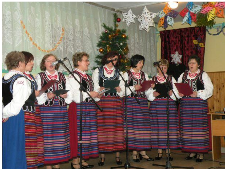
Rysunek nr 3. Przegląd kolęd i pastorałek z 2008 r.

okolicy w której mieszkaś - wakacyjne wycieczki rowerowe, Lato z Gminnym Centrum Kultury, koncerty, Zwiedzanie zabytków i miejsc upamiętniających wydarzenia historyczne na terenie gminy, Dożynki Gminne, Święto pieczonego ziemniaka, "Król grzybobrania", Gminne Obchody Święta Odzyskania Niepodległości, Warsztaty bożonarodzeniowe, Przegląd Kolęd i Pastoralek.