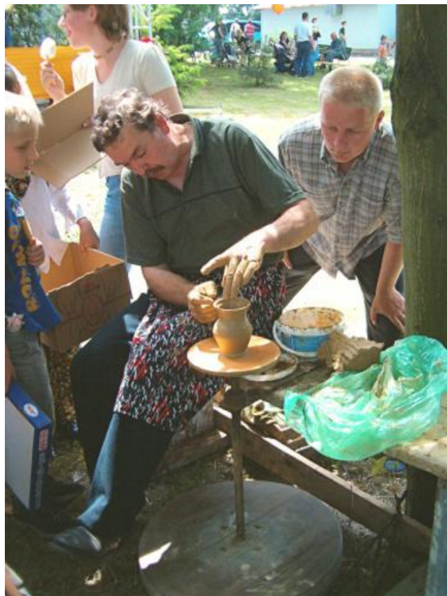
Rysunek nr 4. Pokaz garncarstwa w Baranowie

tej okazji księżde figurowało wówczas 21 garncarzy. Nazwiska wielu z nich przetrwały w Baranowie do czasów obecnych. Obecnie tradycje garncarskie są kultywowane w specjalnie utworzonej pracowni, zaopatrzonej w nowoczesny piec, zlokalizowanej w gimnazjum im. Kardynała Stefana Wyszyńskiego.