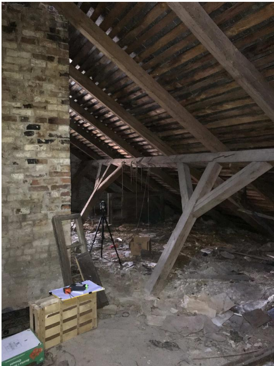
Fot. 33. Poddasze. Więżba dachowa